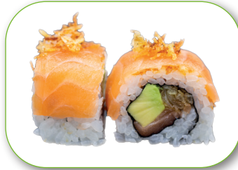
Roll 6 Yoshis Roll