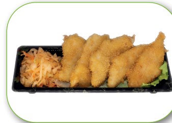
G10 Crispy Chicken