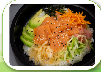
SU12 Sushi Bowl