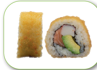
Roll 8 Tempura Lachs