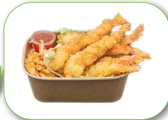
G6 Tempura Garnelen