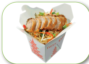
Y1 Nudeln mit Ente