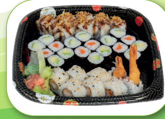
Map1 Maki Platte