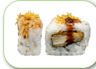
Roll 5 Chicken Teriyaki