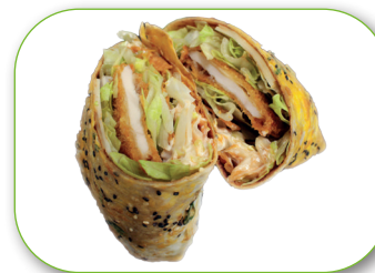
C1 Chinesischer Wrap