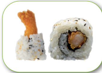
Roll 4 Tempura Roll