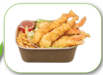
G6 Tempura Garnelen