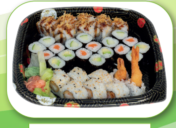
Map1 Maki Platte