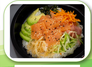
SU12 Sushi Bowl