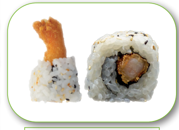
Roll 4 Tempura Roll