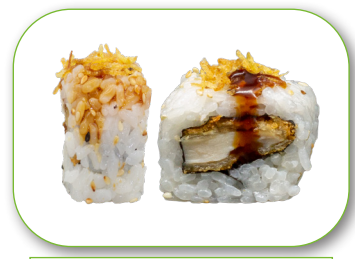
Roll 5 Chicken Teriyaki