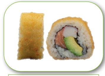
Roll 8 Tempura Lachs