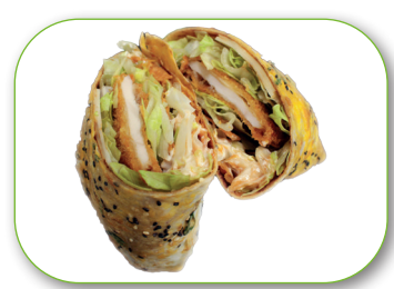
C1 Chinesischer Wrap