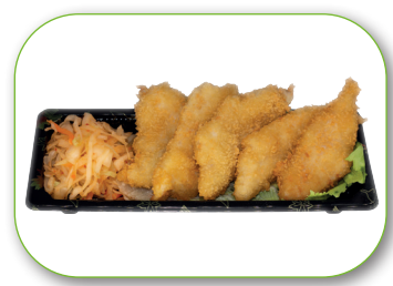
G10 Crispy Chicken