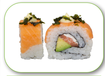
Roll 11 Philadelphia Roll