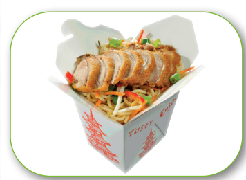
Y1 Nudeln mit Ente